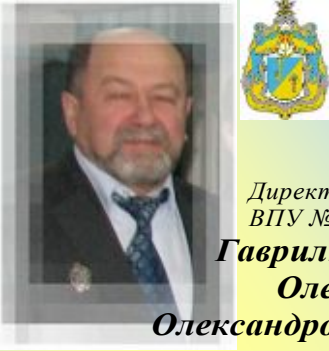
Директор ВПУ №25