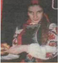
Учнівська кухня «Суп із топірця»