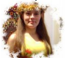
Сторінку підговувала: наш кореспондент Галина Брошневська