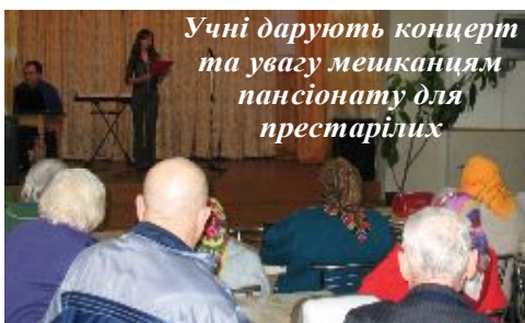
Учні дарують концерт та увагу мешканцям пансіонату для престарілих

В 2008-2009 навчальному році заявила про себе й така важлива ланка учнівського самоврядування, як волонтерська служба «Милосердя». Це організація шефської допомоги дітям-сиротам, ветеранам війни і праці, самотнім людям поважного віку. Наші волонтери налагодили дружбу, допомогу,