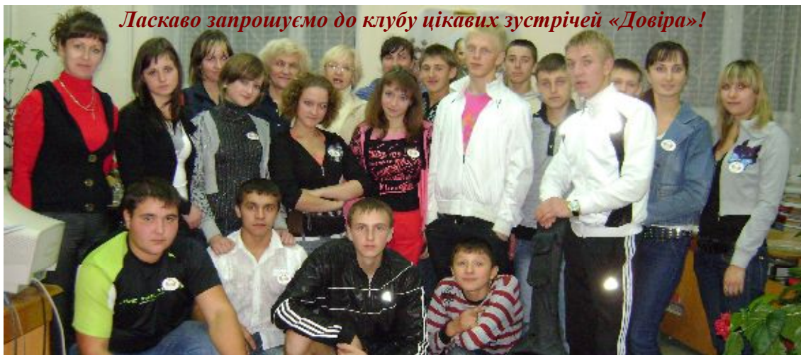
Ласкаво запрошуємо до клубу цікавих зустрічей «Довіра»!

«Якщо тобі коли-небудь захочеться знайти таку людину, яка зможе здолати будь-яку, навіть найважчу біду і зробити тебе щасливим, коли цього не зможе більше ніхто: ти просто подивися в дзеркало і скажи: "Привіт!"»