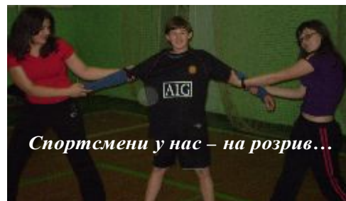
Спортсмени у нас – на розрив...

Якщо ти відчуваєш у собі спортивний потенціал – поповни спортивну команду училища. Проте займатися спортом треба не тільки задля перемог, рекордів, а просто для того, щоб, як-то кажуть, підтримувати форму, бути фізично здоровою людиною, сповненою життєвих сил та енергії. Спортивні секції, які діють в училищі, допоможуть тобі обрати заняття до душі. Крім того, у нас існує цікава традиція – проводити спортивні турніри серед збірних команд учнів і працівників училища. Для цього не обов'язково володіти неабиякими уміннями. Потрібно лише твоє бажання вести активний спосіб життя, бути в гуці подій, що відбуваються в училищі.