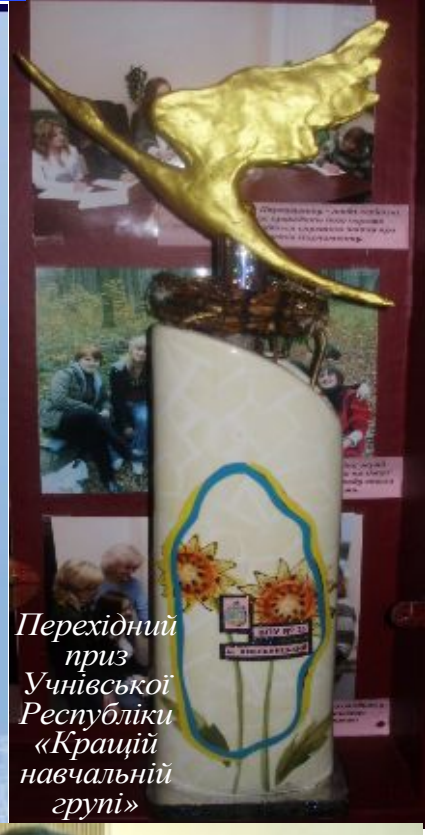
Перехідний приз Учнівської Республіки «Кращій навчальній групі»

Республіканець я! – і цим горджусь по праву: Живу активно, Кращий світ творю, Училища приносять славу, Запам'юючи для майбутнього зору!